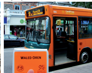
Dyluniwyd gan Gyngor Bro Morgannwg - 04570 11/12